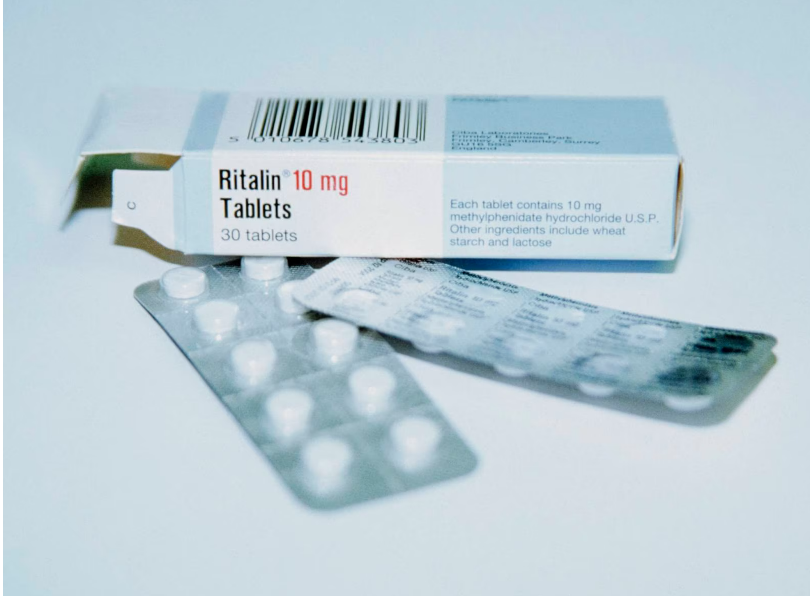
Morgenbladet har bedt om en sammenstilling fra resept- og legemiddelregisteret, som forvaltes av Folkehelseinstituttet. Tallene viser en markant økning i resepter på ADHD-medisin.

Ifølge tall som nå offentligjøres for første gang, har veldig mange fått ADHD-medisin i det siste. På seks år har antall personer med resept doblet seg, bare mellom 2020 og 2022 økte det med hele 40 prosent.