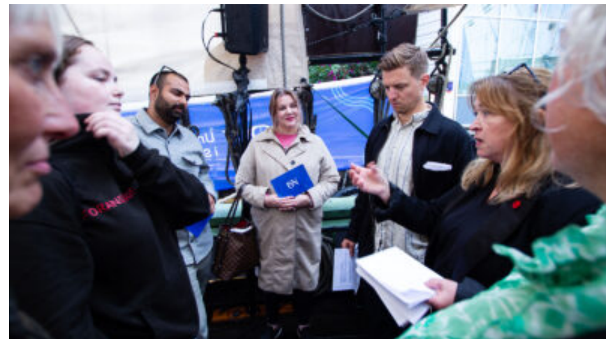
Barna som utfordrer mest: – Her har vi vært for dårlig Nyheter, Pluss