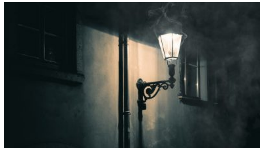
Gaslighting: – En ondskapsfull teknikk for å ta kontroll over et annet menneske