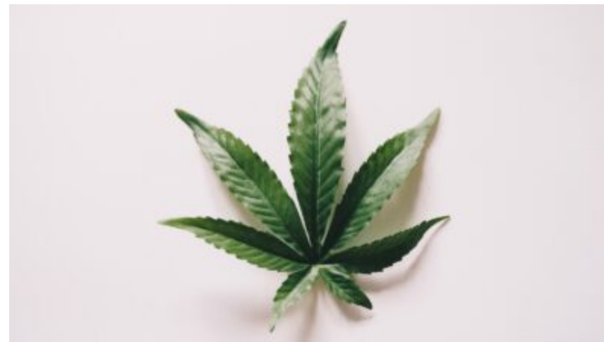
Bratt økning i cannabis-relaterte selvmordsforsøk i USA Nyheter, Pluss