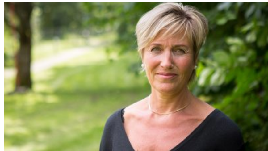
– Den vanligste personlighetsforstyrrelsen er lettast å overse