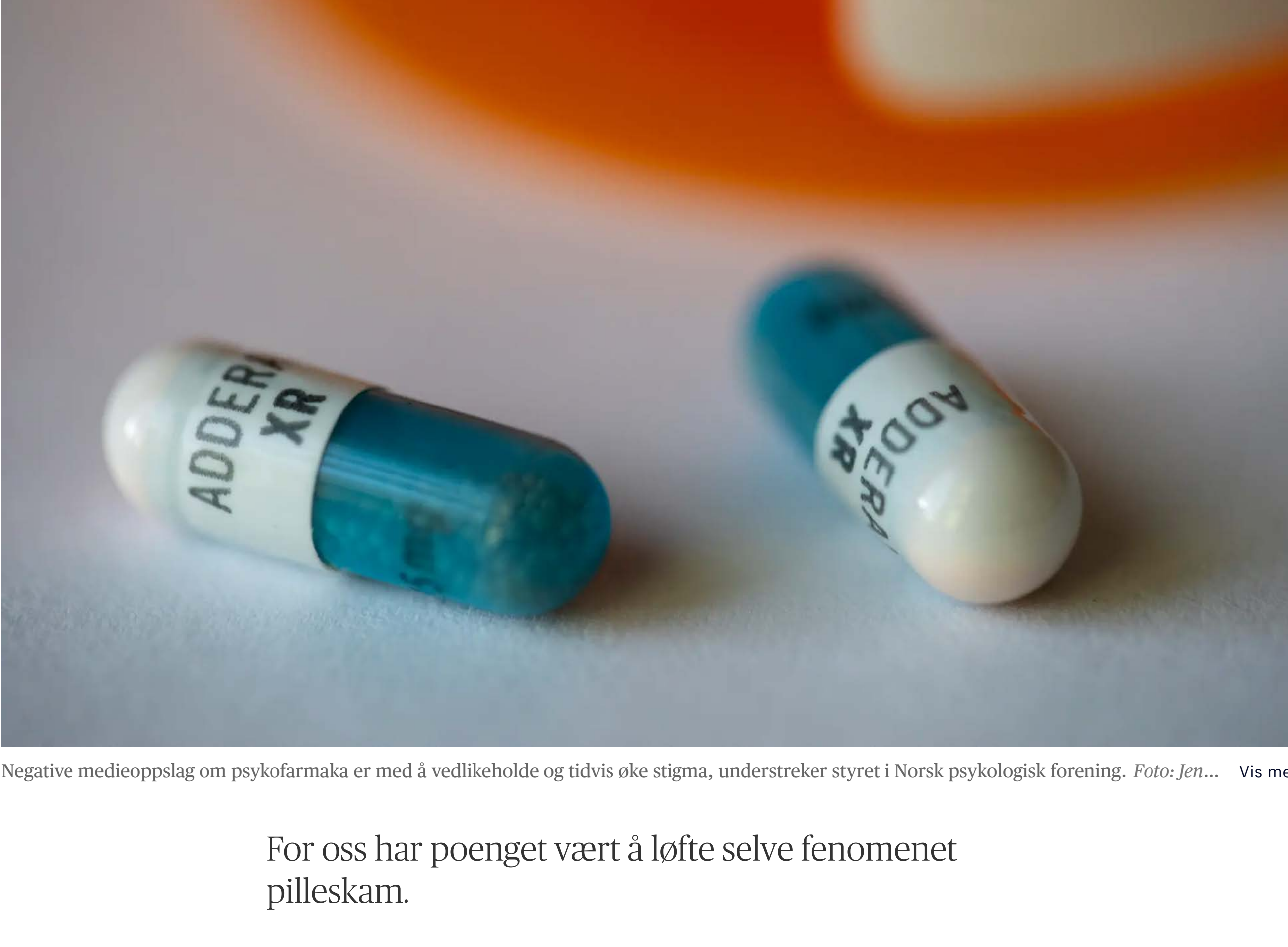
Negative medieoppslag om psykofarmaka er med å vedlikeholde og tidvis øke stigma, understreker styret i Norsk psykologisk forening. Foto: Jem... Vis mer

For oss har poenget vært å løfte selve fenomenet pilleskam.